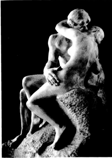
Рис.1. Вечная любовь.

В реальных отношениях чувства людей неотделимы от их потребностей и условий их реализации, даже если они игнорируют какие-то социальные нормы поведения (см. рис.2). Понятно, что при этом любые взаимоотношения представляют известную, но не всегда симметричную взаимозависимость между партнерами этих взаимоотношений. Любимый человек может способствовать удовлетворению многих потребностей, включая и вполне материальные. В частности, ведение совместного хозяйства облегчает жизнь даже при полной экономической самостоятельности партнеров. Вполне естественно тогда ожидать, что потеря этих взаимоотношений или угроза такой потери не будет оставлять человека равнодушным, если эти взаимоотношения ему дороги. Ситуация такой угрозы и является источником возникновения ревности (см. рис. 3).