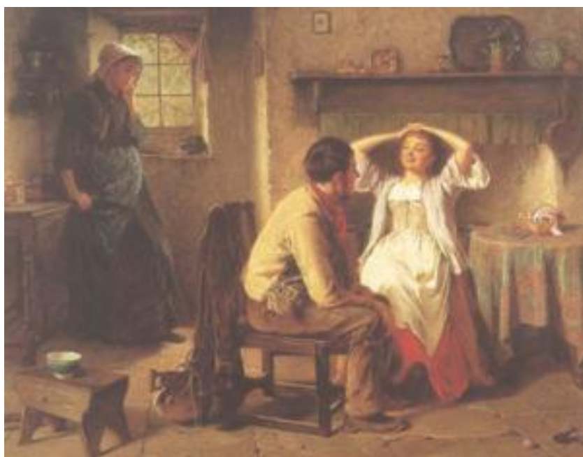
Рис.3. Может ли жена оставаться равнодушной?

Чаще всего, однако, объектом общественного внимания становятся крайние формы ревности, которые можно отнести к бредовой или патологической ревности («синдром Отелло»). Такой синдром предполагает бредовую убежденность в неверности мужа (жены) или любовника/цы. При этом люди многократно предъявляют партнеру обвинения в неверности, основанные на незначительных случаях. Для проверки верности партнеров ревнивцами могут затрачиваться значительные усилия и проводиться длительная слежка за их поведением. Бредовая ревность устойчиво связана с насилием и, в менее острых случаях, с беспокойством и негативизмом. Чаще бредовая Р. появляется у мужчин, чем у женщин, но она не зависит от сексуальной ориентации человека. Тем самым, если крайние формы ревности ведут к патологическим нарушениям или к антисоциальному поведению, то можно ли говорить о том, что любая ревность вредна?