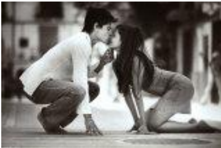
Рис.2. Нас только двое в этом мире.

В реальных отношениях чувства людей неотделимы от их потребностей и условий их реализации, даже если они игнорируют какие-то социальные нормы поведения (см. рис.2). Понятно, что при этом любые взаимоотношения представляют известную, но не всегда симметричную взаимозависимость между партнерами этих взаимоотношений. Любимый человек может способствовать удовлетворению многих потребностей, включая и вполне материальные. В частности, ведение совместного хозяйства облегчает жизнь даже при полной экономической самостоятельности партнеров. Вполне естественно тогда ожидать, что потеря этих взаимоотношений или угроза такой потери не будет оставлять человека равнодушным, если эти взаимоотношения ему дороги. Ситуация такой угрозы и является источником возникновения ревности (см. рис. 3).