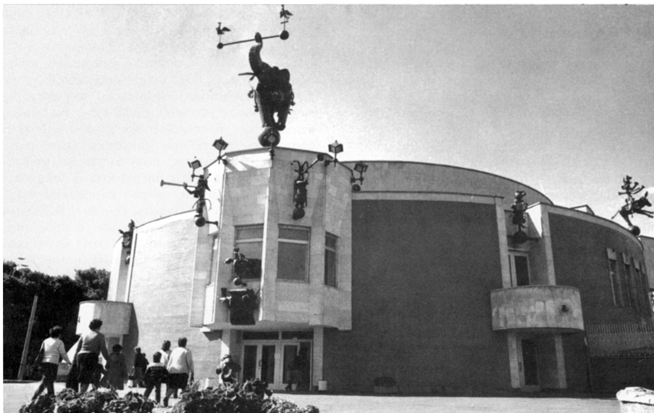
Здание Театра зверей В.Л. Дурова