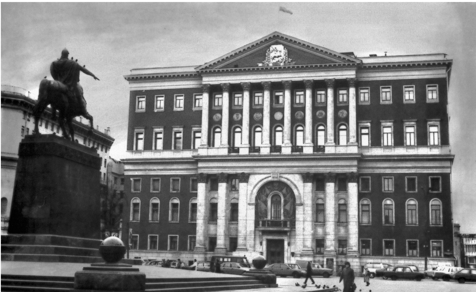
Здание мэрии Москвы (современное фото).

фессором кафедры психологии. Надо прибавить, что вскоре (в 1923 г.) он стал депутатом от московского студенчества в Московском городском Совете депутатов трудящихся и был им до последних дней своей жизни. Так что к моменту, когда Корнилов приступил к реорганизации отечественной психологии, он имел и опыт масштабной организационной работы, и достаточно хорошие деловые связи с наркоматами.