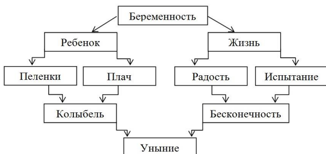
Рис. 3 Ассоциации женщины на слово «беременность»

Результаты такого и следования наглядно показывают, что необходимо переформулирование запроса супругов. Вначале они нуждаются в семейной психотерапии, направленной на гармонизацию их отношений. Только после ее успешного завершения возможна дальнейшая работа, направленная на возникновение беременности. Перинатальные психологи, проходившие у