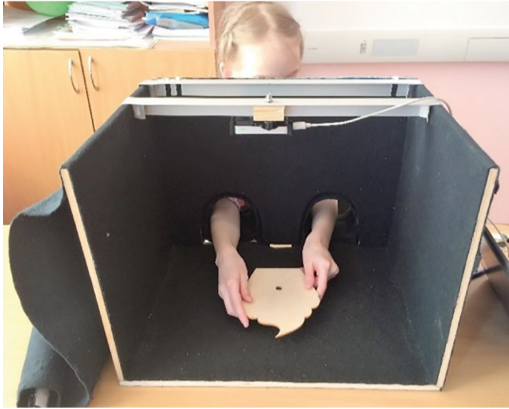
Рис. 2. Камера с датчиком захвата движений рук «Leap motion». Вид изнутри

Обработка данных производилась с помощью стандартных методов математической статистики, включенных в статистические пакеты SPSS Statistics 23.0. В связи с небольшим объемом выборки для статистической обработки данных применялись непараметрический U-критерий Манна-Уитни и Краскела-Уоллиса.