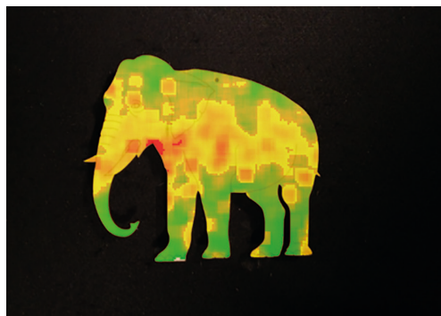
Рис. 3. Тепловая карта движений рук нормативно развивающихся детей по фигуре «Слон»