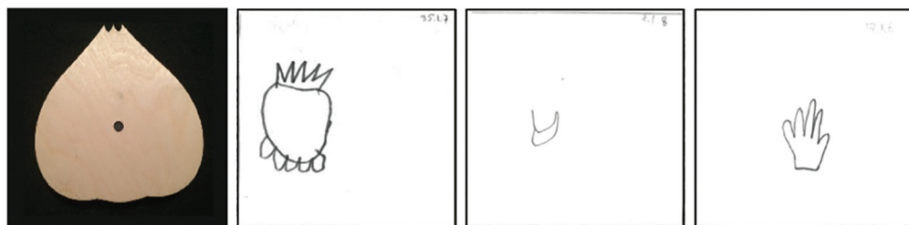
Рис. 6. Фотография фигуры «Луковица» и справа от нее рисунки фигуры трех детей с РАС восьми лет после ее гаптического обследования

Анализ качественного состава ошибок также показал ряд различий между группами. В среднем 78,2 % рисунков детей из контрольной группы после восприятия фигур в гаптической модальности содержали основную форму фигуры (рис. 5). Ошибки допускались при передаче размера и расположения деталей относительно общей формы и величины фигуры, что влекло за собой неточности отражения контура. При зрительном восприятии фигуры успешность передачи контура наблюдалась в 96,1 % рисунков.