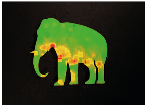
Рис. 4. Тепловая карта движений рук детей с РАС по фигуре «Слон»

никами при обследовании фигур как в гаптической ( p < 0,01 ), так и в зрительной ( p < 0,01 ) модальности (табл. 1).