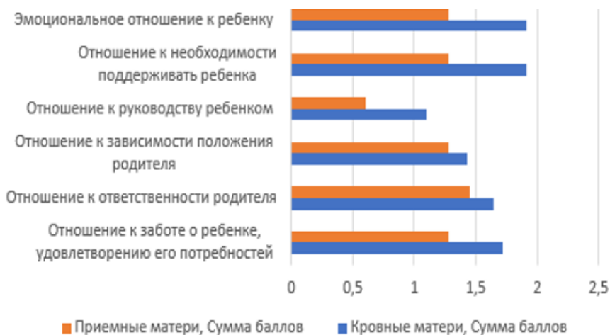
Рис. 2. Принятие родительской позиции. Соотношение показателей по группам биологических и замещающих матерей, баллы

Анализ массива данных по методике «Опросник принятия родительской позиции» показал, что обнаружены статистически значимые различия по показателям: «Отношение к необходимости поддерживать ребенка» (соответственно: биологические мамы — 1,96 балла, SD \pm 1,06 ; замещающие — 1,2 балла; SD \pm 1,6 ; F=0,039 ; p=0,010 ), «Эмоциональное отношение к ребенку» (биологические мамы — 1,2 балла, SD \pm 1,164 ; замещающие мамы — 1,9667 балла, SD \pm 1,06 ; F=0,039 ; p=0,010 ); по показателю «Отношение к руководству ребенком» обнаружена тенденция к значимости (биологические — 1,1167 балла, SD \pm 1,25 ; замещающие — 0,566 балла, SD \pm 0,96 ; F=1,066 ; p=0,61 ). Как показано на рис. 2, более высокие значения данных показателей отмечаются в выборке биологических матерей.