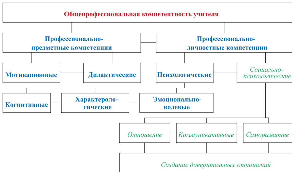
Рис. 2. Модель социально-психологической компетентности учителя: на схеме жирным шрифтом отмечены общепрофессиональные, а курсивом — социально-психологические компетентности учителя