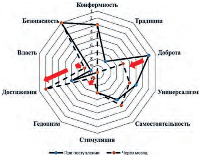
Рис. 7. Динамика индивидуальных приоритетов у респондентов с высоким уровнем психоэмоционального напряжения на 2-м этапе исследования (n = 30)

где: Y_{пэ} – значение фактора психоэмоционального напряжения; X_{сам} – значение параметра «самостоятельность»;