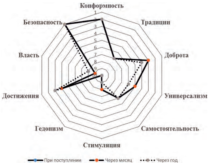
Рис. 5. Динамика нормативных идеалов у респондентов с низким уровнем психоэмоционального напряжения ( n = 30 )