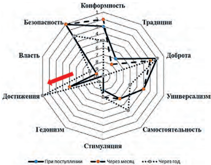
Рис. 9. Динамика индивидуальных приоритетов у респондентов с низким уровнем психоэмоционального напряжения ( n = 30 )

X_{дос} — значение параметра «достижения»; X_{доб} — значение параметра «доброта».