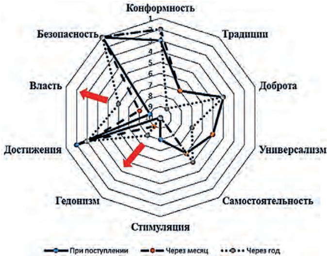
Рис. 1. Динамика нормативных идеалов на всех этапах исследования ( n = 120 ): здесь и далее (рис. 2, 3, 6, 7, 8 и 9) стрелками показана направленность значимых изменений ценностей по отношению к таковым на предыдущих этапах исследования