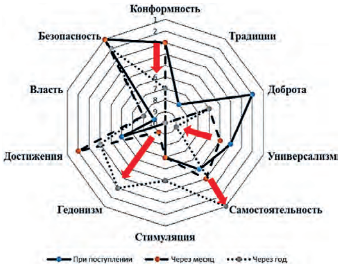
Рис. 8. Динамика индивидуальных приоритетов у респондентов с высоким уровнем психоэмоционального напряжения на 3-м этапе исследования ( n = 30 )