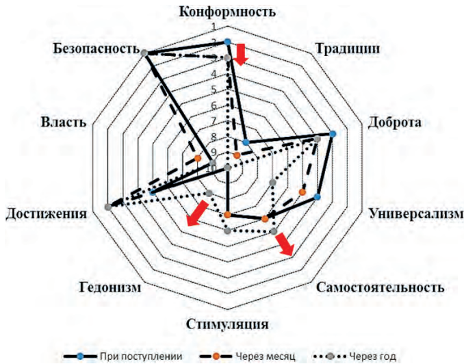
Рис. 3. Динамика индивидуальных приоритетов на 3-м этапе исследования ( n = 120 )