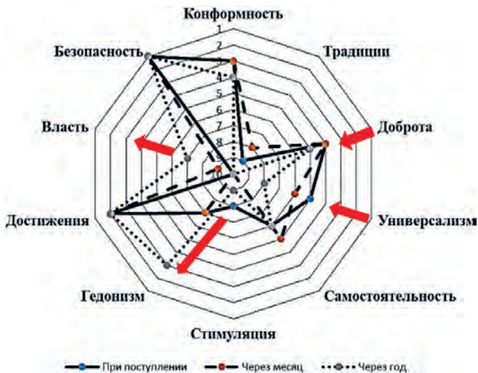
Рис. 6. Динамика нормативных идеалов у респондентов с высоким уровнем психоэмоционального напряжения ( n = 30 )

низм» (с девятого до третьего ранга), а также формировалась ценностная оппозиция «безопасность-самостоятельность». У респондентов с низким уровнем психоэмоционального напряжения на заключительном