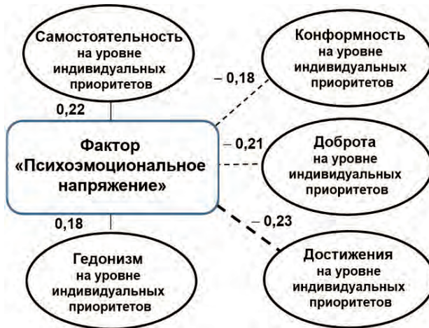
Рис. 10. Корреляции фактора психоэмоционального напряжения с параметрами индивидуальных приоритетов на заключительном этапе исследования ( n = 120 )

же с высокой эффективностью адаптации динамика ПЦС была иной: 0,48 у.е. на первом этапе, 0,33 у.е. — на втором ( p \leq 0,05 по сравнению с первым) и 0,45 у.е. — на третьем. При этом различия на первых этапах исследования между значениями ПЦС у респондентов сравниваемых групп были несущественными, а на последнем достигали уровня статистической значимости.