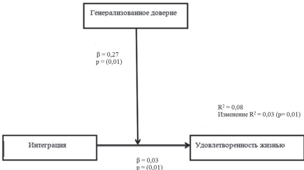
Рис. 1. Доверие как модератор связи аккультурационного ожидания «интеграция» и удовлетворенностью жизнью

Проведя анализ модерационного эффекта генерализованного доверия на связь между аккультурационным ожиданием «интеграция» и удовлетворенностью жизнью, мы получили следующие результаты (рис. 1).