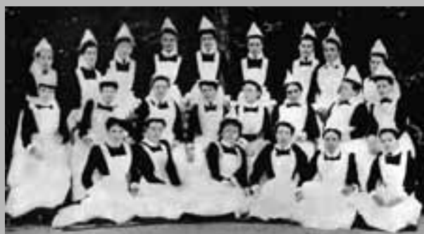
Женский персонал Нормансфилда. 1880-е годы

К началу 80-х годов XIX века медицинская карьера Джона Лэнгдона Дауна достигла своего расцвета. Известный ученый и талантливый врач, успешно управлявший лучшим реабилитационным учреждением в Европе, он пользовался при-