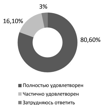
Рис. 2. Общая удовлетворенность респондентов условиями предоставления социальной помощи на дому (получающие надомную социальную помощь от семьи)

с законодательством. Большинство респондентов, получающих надомную социальную помощь от социальной службы, удовлетворены индивидуальной программой и условиями договора об оказании социальных услуг на дому (рис. 1).