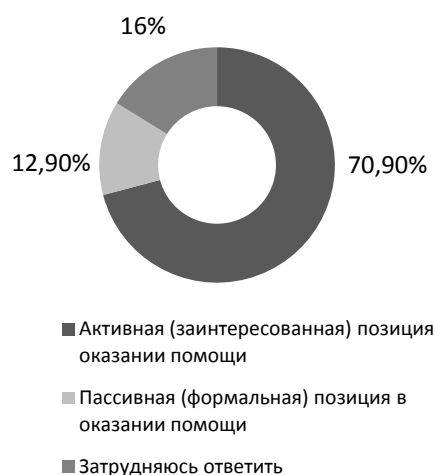
Рис. 4. Позиция семьи при оказании социальной помощи на дому (ответы респондентов, получающих надомную социальную помощь от семьи)

услугам по просьбе самих пожилых людей. Результаты исследования свидетельствуют, что респонденты в целом удовлетворены условиями, оговоренными в индивидуальной программе и договоре, и ими самими больше всего востребованы услуги социально-бытового характера. Так, анализ оценочных суждений клиентов надомного отделения показал, что основными услугами, которые они получают, являются: