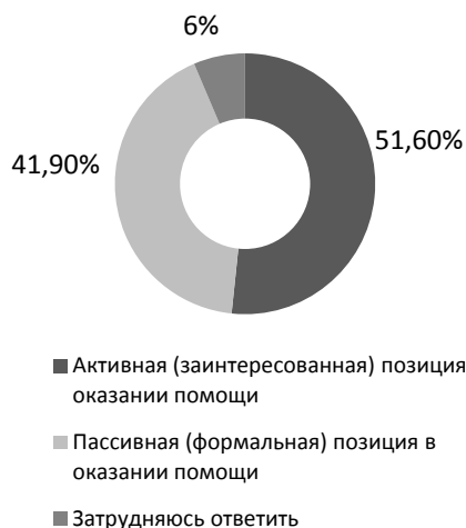
Рис. 3. Позиция социальной службы при оказании социальной помощи на дому (ответы респондентов, получающих надомную социальную помощь от социальной службы)