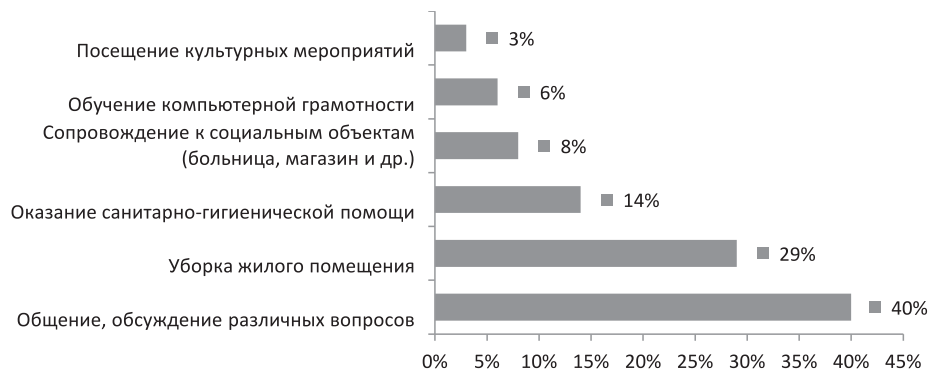
Рис. 2. Предпочтения пожилых людей по оказанию им добровольческих услуг

На втором этапе исследования было проведено интервью с руководителем данного государственного бюджетного учреждения о возможности