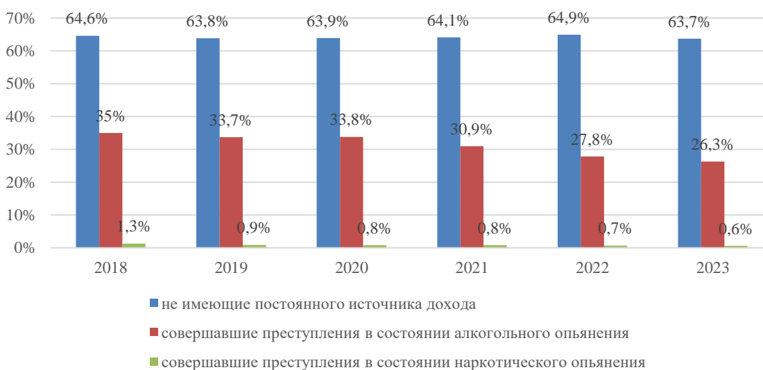
Рис. 3. Доля лиц, ранее совершивших преступления, не имеющих постоянного источника дохода; доля лиц, совершавших преступления в состоянии алкогольного опьянения; доля лиц, совершавших преступления в состоянии наркотического опьянения, от общего числа лиц, совершивших преступления в период с 2018 по 2023 г

лиц находились в условиях отсутствия возможности трудоустроиться, трудиться и получать в достаточной мере средства для удовлетворения своих минимальных потребностей, в частности витальных, обуславливающих саму возможность жить в физическом понимании. Фактор безработицы, относительно личности, имеет объективно-субъективный характер, так как, безусловно, оказывает влияние на рост преступности, в частности на рост корыстных преступлений [6]; но в то же время решение добывать средства преступным путем принимается человеком, как правило, осознанно, а следовательно, лежит в плоскости мировосприятия, системы допустимого и недопустимого в картине мира самого субъекта.