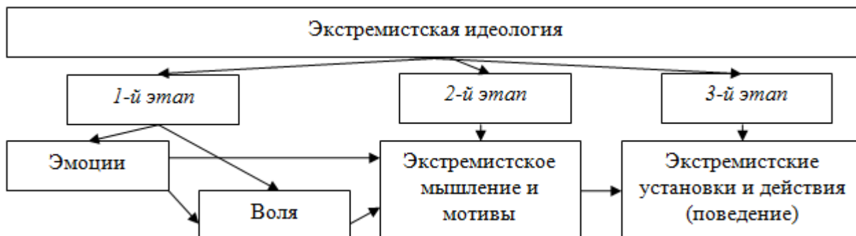
Рис. 1. Влияние экстремистской идеологии на молодого человека, отражающее этапы развития у него экстремистского поведения

По мнению школьных педагогов-психологов, беседы с которыми мы проводили, вовлечение в экстремистскую группу зачастую субъективно становится для молодого человека компенсаторной формой обретения идентичности, так как дает/обещает ему следующие компенсации: реальный (иногда предельный) смысл жизни; достойное место в жизни; чувство принадлежности, избранности, неподвластности; выход за пределы обыденности. Результаты нашего исследования в этом аспекте согласуются с данными, полученными Д.П. Ищенко и Д.К. Григорян, которые рассматривают экстремизм как своеобразный способ самореализации молодежи в современном обществе и средство достижения власти [15].