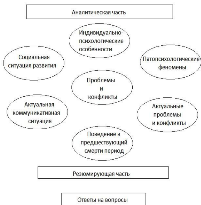
Рис.4. Основные элементы заключения эксперта-психолога в рамках комплексной судебной психолого-психиатрической экспертизы по факту самоубийства несовершеннолетних

Материалы уголовного дела, как правило, позволяют провести описанный выше анализ и подготовить ответы на вопросы следствия. Однако заключение эксперта должно иметь доказательное значение, в связи с чем рекомендуется строить его в определенной последовательности, сходной с уже описанной логикой анализа (рис.4).