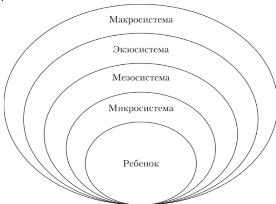
Рис. 2. Многоуровневая система социального окружения

В области внешних факторов можно выделить несколько основных компонентов. Наиболее общий – социальная ситуация развития несовершеннолетнего, под которой, вслед за Л.С. Выготским, мы понимаем «специфическую для каждого возраста систему отношений ребёнка с окружающим миром» [1]. Таким образом, это не просто окружающая ребенка, подростка, социальная среда, а именно система его отношений с окружением в широком смысле слова. Окружение ребенка имеет ряд уровней, которые демонстрирует схема, предложенная У. Бронфенбреннером в рамках созданной им теории экологических систем [7].