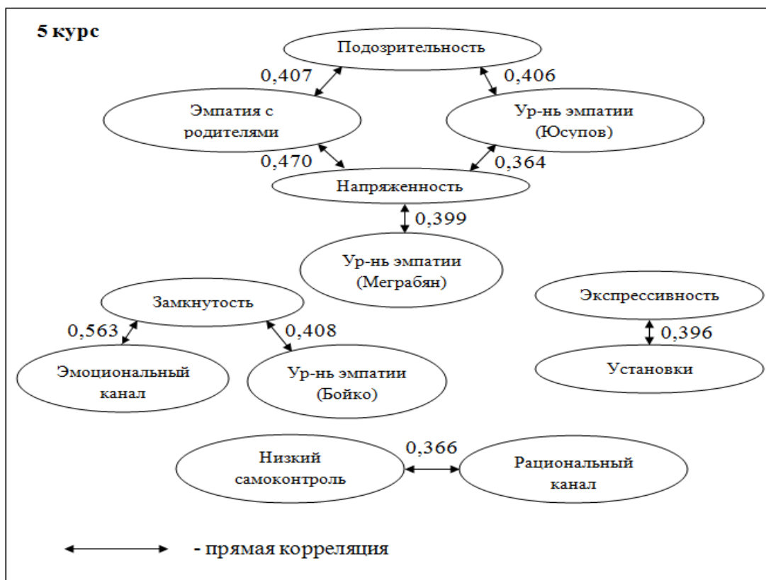
Рис. 3. Корреляционная плеяда личностных и эмпатических особенностей студентов 5 курса

Поскольку у большинства респондентов пятого курса выявлена тревожность, пронизательность в сочетании с тревогой может выступать как настороженность, подозрительность и излишняя эмоциональная защита. Этим же можно объяснить прямую корреляцию эмпатии с родителями и общего уровня эмпатии по методикам Юсупова и Меграбяна с напряженностью.