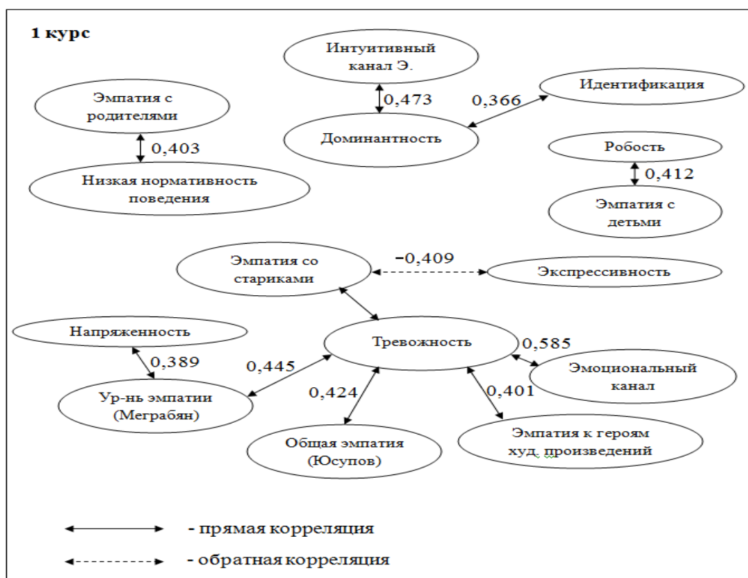
Рис. 2. Корреляционная плеяда личностных и эмпатических особенностей студентов первого курса

Прямая зависимость между доминантностью и двумя каналами эмпатии – интуитивным и идентификацией. Фактор доминантности может выступать в данном случае как самостоятельность и настойчивость, эти качества, в свою очередь, способствуют умению действовать интуитивно в условиях дефицита информации о партнере, а также умению ставить себя на место другого человека.