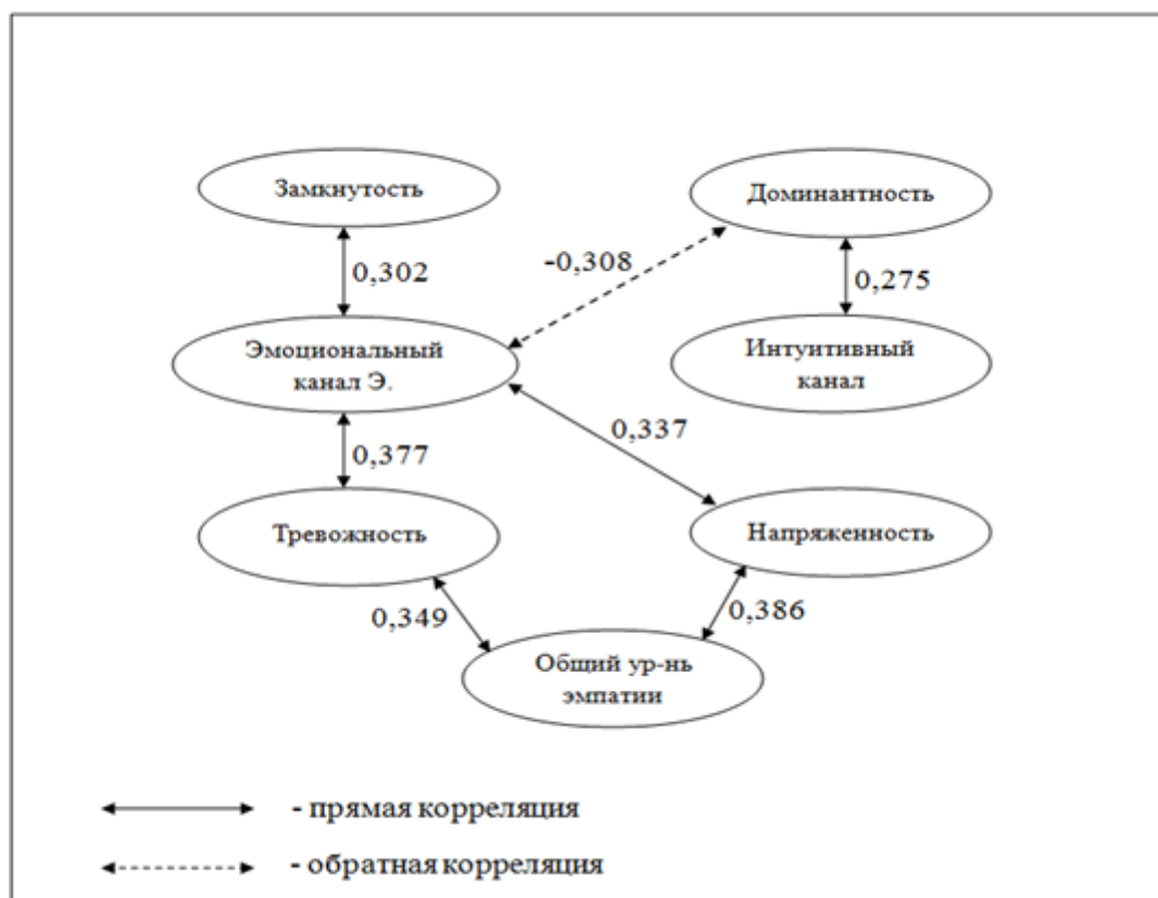
Рис. 4 Корреляционная плеяда личностных и эмпатических особенностей студентов-психологов в общей группе

Прямая зависимость между доминантностью и интуитивным каналом эмпатии предположительно означает, что настойчивость и самостоятельность способствуют интуитивным действиям в условиях дефицита информации о другом человеке. В то же время, обратная взаимосвязь доминантности и эмоционального канала эмпатии свидетельствует о том, что проявление чрезмерной напористости и своенравия препятствует умению эмоционально сопереживать партнеру.