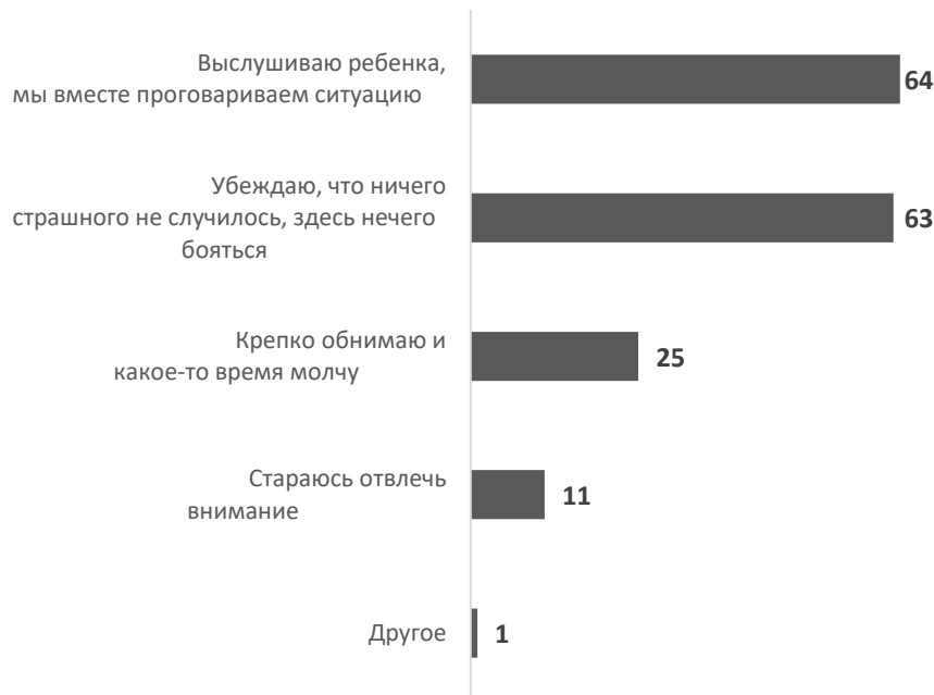
Рис. 2. Родительские реакции на детские страхи 4

Интересно, что по мере взросления ребенка родители реже «обнимают» и чаще «отвлекают» своих детей. При этом родители с высшим образованием уровня бакалавриат несколько чаще «обнимают и молчат», а родители со средним специальным образованием – «выслушивают и проговаривают».