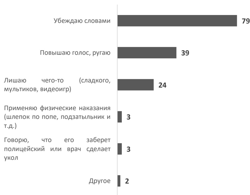
Рис. 3. Меры воздействия родителей на ребенка, который совершил «плохой» поступок 6

ситуации» (79%). Более трети родителей эмоционально реагируют на «плохое поведение» своих детей – «повышают голос, ругают» (39%) и почти четверть используют стратегию лишения ребенка того, что он любит – «сладкое, мультики, видеоигры» (24%). При этом российские родители стараются не применять такие меры воздействия, как «физическое наказание (шлепок, подзатыльник)» и угрозы (например, что ребенка «заберет полицейский или врач сделает укол» (по 3% каждый).