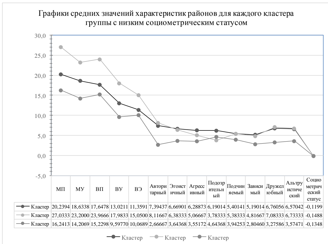
Рис. 3. Средние значения характеристик районов для каждого кластера: МП – межличностное понимание эмоций; МУ – межличностное управление эмоциями; ВП – внутриличностное понимание эмоций; ВУ – внутриличностное управление эмоциями; ВЭ – контроль экспрессии

Далее были сопоставлены уровни развития компонентов эмоционального интеллекта и преобладающих типов межличностных отношений молодых людей с высоким и низким социометрическим статусом. Распределение респондентов внутри кластеров: