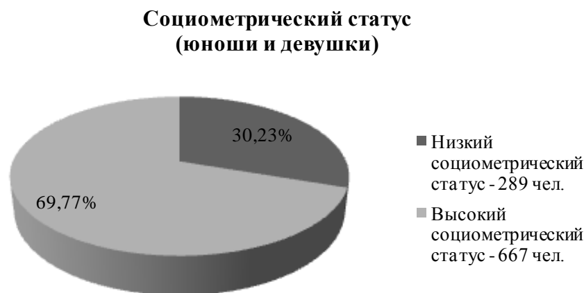
Рис. 1. Распределение юношей и девушек по социометрическому статусу

Методы исследования. Методики подбирались с целью получения данных об уровне развития компонентов эмоционального интеллекта, о предпочитаемых типах межличностных отношений и социометрическом статусе личности в группе: