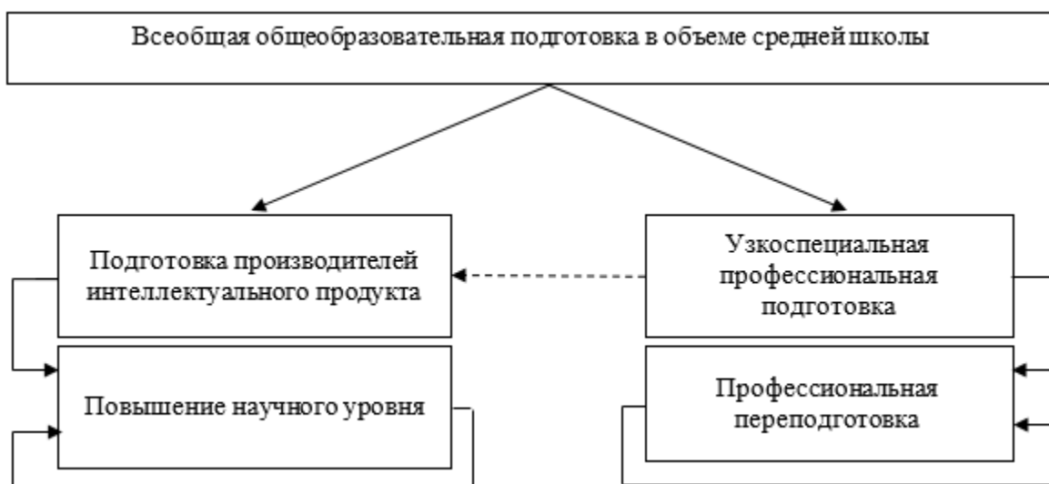
Рис. 1. Обобщенная структура целесообразной структуры системы современного образования

подготовка. Несомненно, она должна откликаться на обусловленные развитием цивилизации изменения, а методики обучения постоянно совершенствоваться, учитывая необходимость и возможность развития индивидуальных особенностей ребенка в новых условиях. Однако по своему основному содержанию именно школьное образование обязано быть консервативным, поскольку входящий в жизнь человек должен освоить все основные знания современной цивилизации, пройдя при этом в силу логики своего психического и физиологического развития вполне определенные этапы.