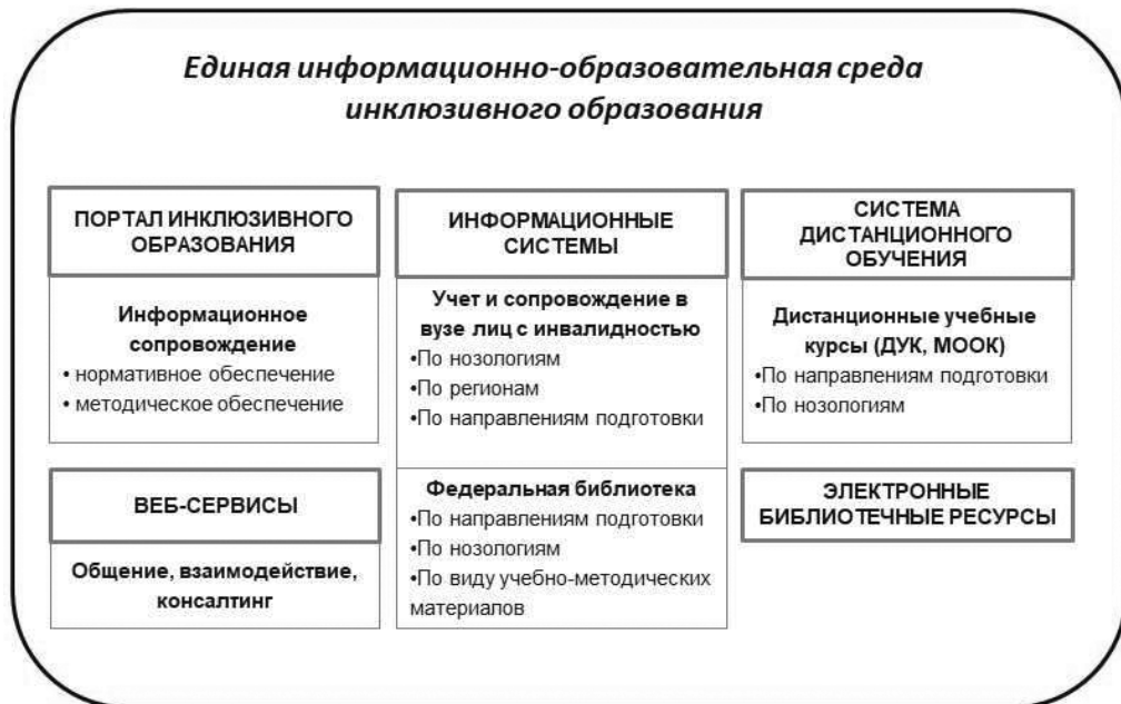
Рис. 3. Содержание единой информационно-образовательной среды инклюзивного высшего образования

Подводя итоги, отметим, что развитие форм сетевого взаимодействия участников в организации обучения студентов с инвалидностью носит адаптационный характер и является отражением изменения условий реализации современной образовательной деятельности. Эти изменения связаны со значительным ускорением инноваций, внедряемых в образование, расширившимися