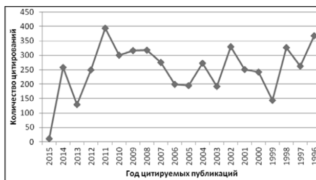
Рис. 2. Распределение цитирований по годам цитируемых публикаций (1996–2015 гг.) (РИНЦ)

В табл. 5 представлен первый квартиль тематик цитирующих журналов. Общее количество тематик составляет 32.