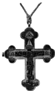
Крест натальный Н. В. Гоголя.

предсмертные слова А.С. Пушкина, обращенные к Владимиру Ивановичу Далю: «Ну, подымай же меня, пойдем, да выше, выше... ну, пойдем!» [23, т. 2, с. 405].