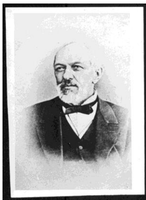
Доктор А.Т. Тарасенков

знаком. Существует свидетельство, что Тарасенков пользовал семью графа Александра Петровича Толстого 2 , в доме которого в Москве на Никитском бульваре жил последние годы Гоголь. Из записок Тарасенкова явствует, что впервые он увидел Гоголя в январе 1852 года, обедая у графа Толстого (дата последнего обеда, на котором присутствовал Тарасенков, скорее всего 22 января).