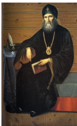
Святитель Филарет, митрополит Московский

Вот что, например, сказал о посте святитель Русской Церкви митрополит Московский Филарет 10 февраля 1852 года в «Неделю сыропустную», то есть в последнее воскресенье перед Великим постом; в этот день в церкви провозглашаются слова святого апостола Павла: «Облецытесь Господем нашим Иисус Христом, и плоти угодия не творите в похоти» (Рим. 13, 14), то есть: «Облекитесь в Господа (нашего) Иисуса Христа, и попечения о плоти не превращайте в похоти». На полях принадлежавшей Гоголю Библии (ныне хранится в Рукописном отделе Пушкинского Дома) против этого места помета: «Облецытесь Господем Христом» [8, т. 9, с. 151].