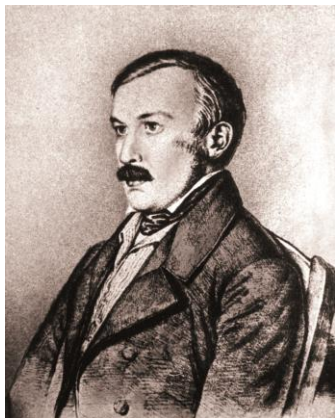
Граф А. П. Толстой

осмотреть Гоголя 13 февраля, Тарасенков и в тексте 1852, и в тексте 1856 года пишет, что именно граф Толстой рассказал ему о происходившем с больным.