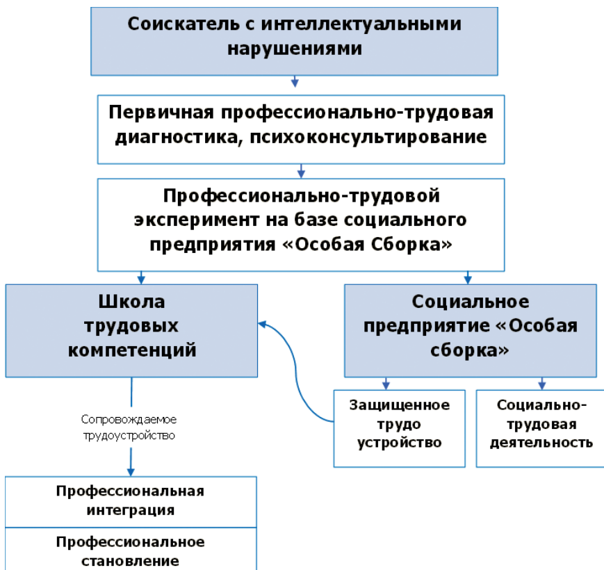
Рис. 1. Модель технологии включенного трудоустройства