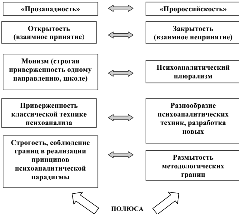
Рис. 1. Поляризация тенденций в развитии современного отечественного психоанализа.

По моему мнению, развитие психоаналитического движения в современной России характеризуется рядом тенденций, каждую из которых можно представить в виде континуума, крайние точки которого в содержательном плане представляют собой полярности. Предполагается, что развитие может протекать в направлении любой из этих полярностей (см. рис. 1).