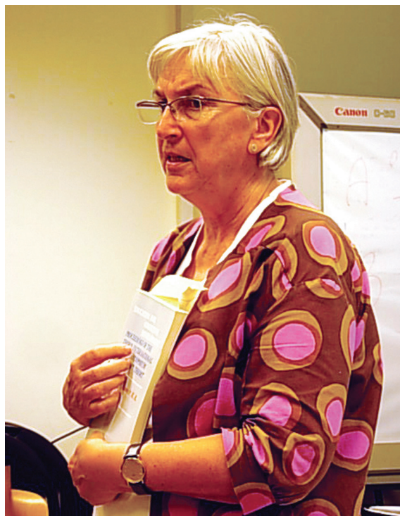
М. Хедегард, первый президент ISCAR (Дания)