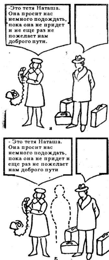
Рис. 2. Тест Розенцвейга : а) обычный, б) — модифицированный [26, 1985].

Феномены влияния автор изучал эмпирически, в соавторстве с И.П. Гуренковой; использовалась предложенная автором модификация теста фрустрационных реакций Розенцвейга [см.: 37] (рис. 2):