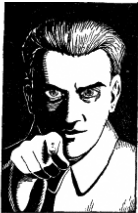
Рис. 3. «На кого смотрит дядя?»

На рис. 3 изображен мужчина, показывающий пальцем на зрителя (в оригинальной версии — красноармеец с плаката времен Гражданской войны). На кого смотрит и показывает пальцем человек с плаката? Меняя позицию наблюдения, получаем разный ответ.