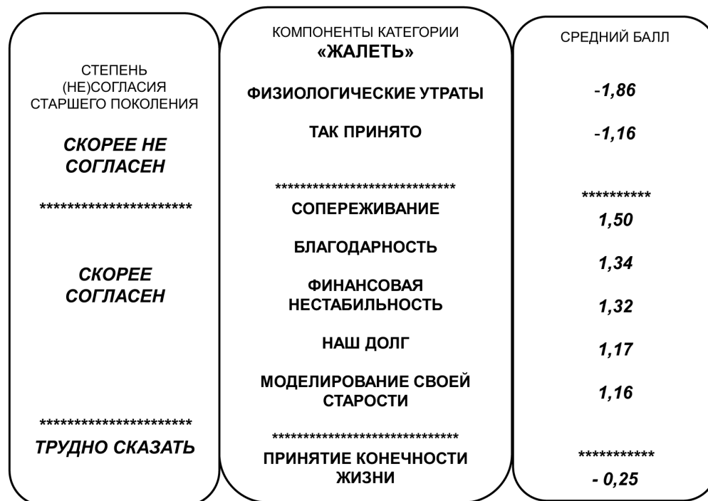
Рис. 3. Соотношение степени (не)согласия респондентов старшего поколения с компонентами детской категории «жалеть»