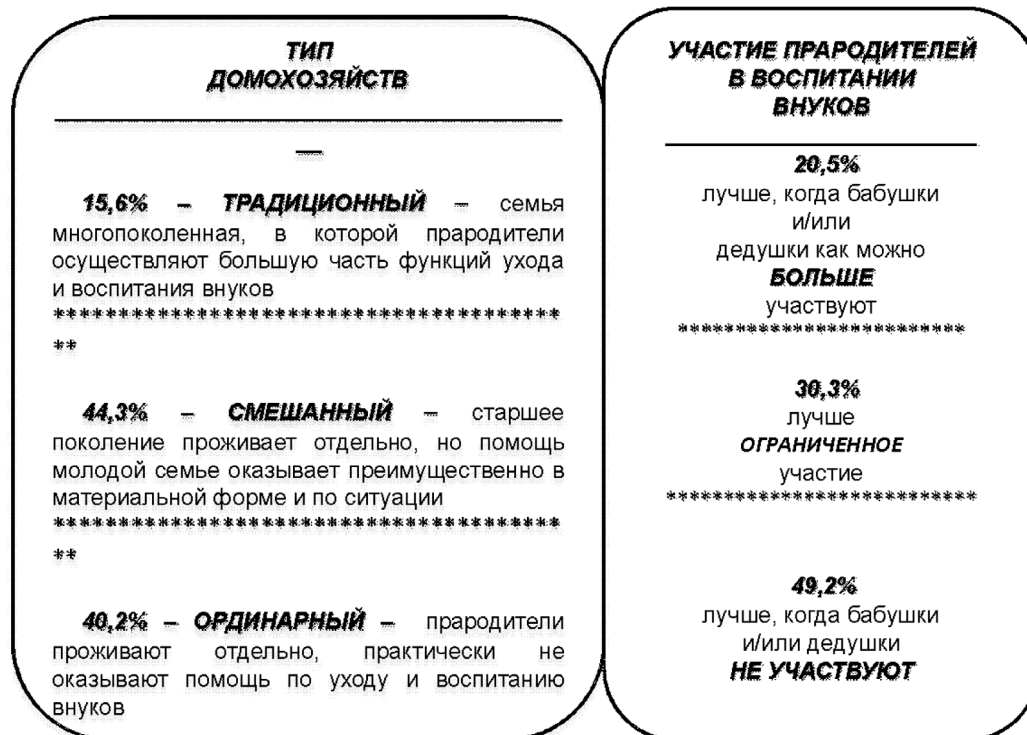
Рис. 2. Сопоставление частоты выборов типов семей по степени использования поддержки прародителей по воспитанию детей и уходу за ними

Следующим шагом на основе уточняющих суждений был реализован качественный анализ доминантных категорий отношений: в группе младших школь-