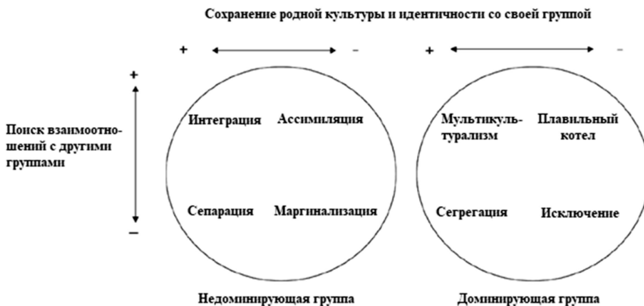
Рис. 1. Аккультурационные стратегии этнических меньшинств и аккультурационные ожидания принимающего населения по классификации Джона Берри [приводится по: 7]

Согласно гипотезе контакта, положительный опыт взаимодействия с другой группой может вести к снижению межгрупповой напряженности [6; 16]. Согласно данной гипотезе и дальнейшим исследованиям Т. Петтигрю, при условии личного взаимодействия некоторые стереотипы относительно чужой группы могут видоизменяться в лучшую сторону. Однако стоит заметить, что если при личном общении некоторые стереотипы подтверждаются, то негативные установки могут усугубиться. В особенности это может касаться экономической угрозы, так как, согласно теории этнической конкуренции [14], в дан-