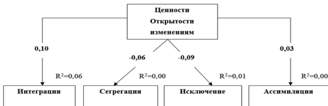
Рис. 3. Путьевая модель взаимосвязи ценностей Открытости изменениям с аккультурационными ожиданиями принимающего населения. Параметры модели удовлетворительны: CMIN/df=1.54; p=.083 ; CFI=.92; RMSEA=.05; SRMR=.06.

Результаты, представленные на рис. 6, показывают, что ценности Самоутверждения статистически значимо отрицательно связаны с аккультурационным ожиданием «Интеграция» и значимо положительно связаны с аккультурационными ожиданиями «Сегрегация» и «Ассимиляция».