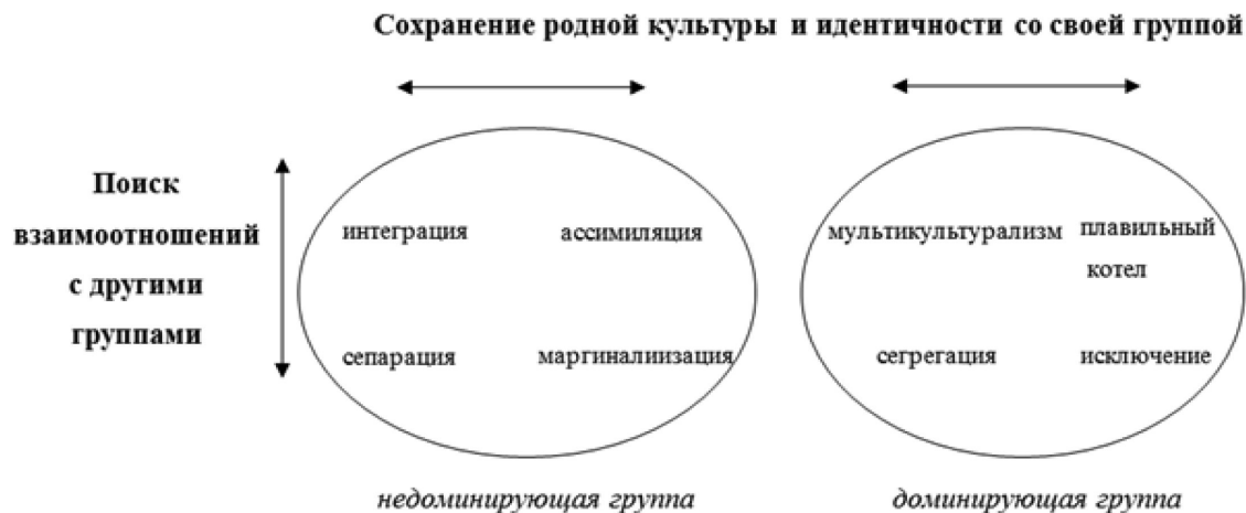
Рис. 2. Стратегии аккультурации, по Дж. Берри [7]

Аккультурационные ожидания представителей принимающего общества были оценены с помощью 16 утверждений [4], образующих 4 шкалы. Пример пункта аккультурационного ожидания «Интеграция» («Мультикультурализм»): «Иммигранты должны владеть в совершенстве и родным, и русским языком»; пример пункта аккультурационного ожидания «Сегрегация»: «Иммигранты должны иметь друзей только своей национальности»; пример пункта аккультурационного ожидания «Ассимиляция»: «Иммигрантам следует участвовать в тех видах деятельности, в которых участвуют только русские»; пример пункта аккультурационного ожидания «Исключение»: «Я считаю, что иммигрантам не важно