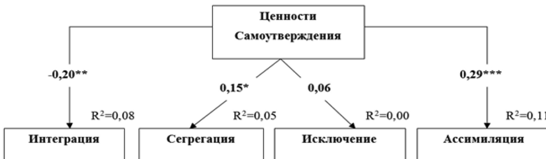
Рис. 6. Путьевая модель взаимосвязи ценностей Самоутверждения с аккультурационными ожиданиями принимающего общества. Параметры модели: CMIN/df=1,52; p=.102; CFI=.95; RMSEA=.05; SRMR=.06.

Примечание: «***» – p < .001; «**» – p < .01; «*» – p < .05 (двусторонняя)