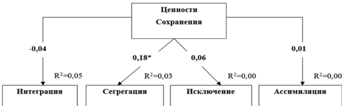
Рис. 5. Путьевая модель взаимосвязи ценностей Сохранения с аккультурационными ожиданиями принимающего общества. Параметры модели: CMIN/df=1,19; p=.277; CFI=.98; RMSEA=.03; SRMR=.05.

Примечание: «***» – p < .001; «**» – p < .01; «*» – p < .05 (двусторонняя)