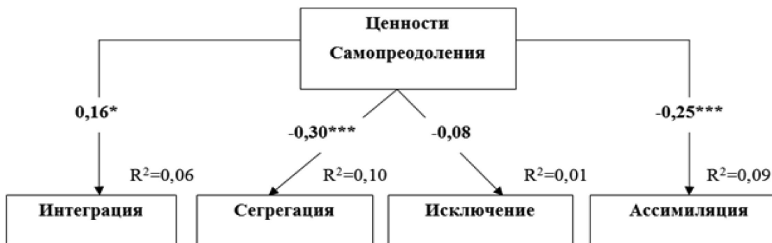
Рис. 4. Путьевая модель взаимосвязи ценностей Самопреодоления с аккультурационными ожиданиями принимающего общества. Параметры модели удовлетворительны: CMIN/df=1,44; p=.127; CFI=.96; RMSEA=.05; SRMR=.06.

Довольно любопытной оказалась роль ценностей Самопреодоления представителей принимающего населения в их аккультурационных предпочтениях. В результате путевого анализа выяснилось, что данные ценности, выражающиеся в принятии других лю-