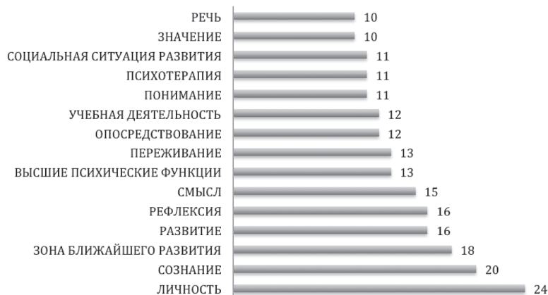
Рис. 2. Количество публикаций журнала «Культурно-историческая психология», опубликованных за период 2005—2016 гг., на одно тематическое направление (по данным РИНЦ)