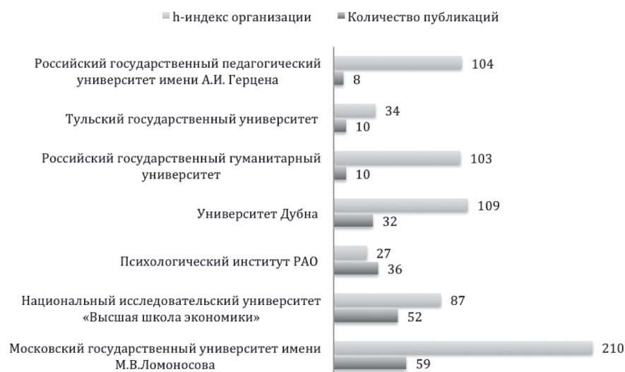
Рис. 1. Аффилиация авторов журнала «Культурно-историческая психология», опубликованных за период 2005—2016 гг.