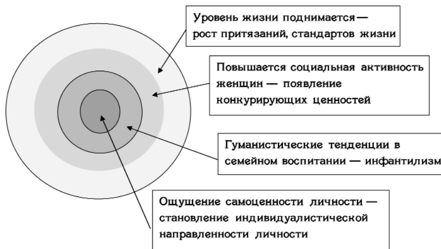
Рис. 2. Характер социальных тенденций, создающих риски для становления позитивного отношении женщины к материнству

На мезоуровне (уровень семейной системы) можно констатировать усиление гуманистической традиции в системе воспитания ребенка [4]. В заботе о ребенке семья стремится к все более полному удовлетворению его потребностей, что может приводить к формированию у него инфантилизма, к недостаточной его самостоятельности. Важным, на наш взгляд, является утверждение Д.Б. Винникота о необходимости оставлять место для собственной активности ребенка, т. е. быть «достаточно хорошей