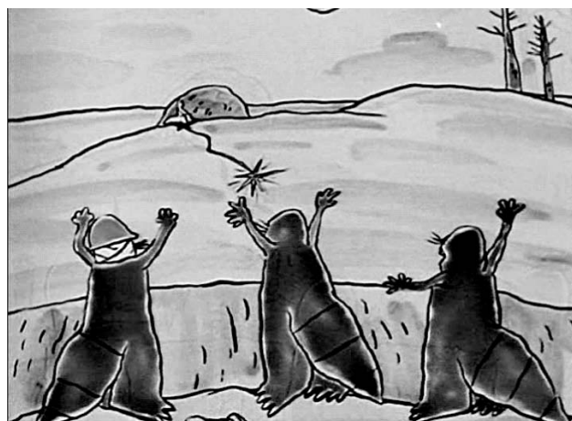
Рис. 4. Кадр, в котором на первом плане видны махающие руками бобры и горящий фитиль, а на заднем — сидящий на бомбе Белый бобер

4. Эпизод, где Белый бобер находит бомбу и, приняв ее за яйцо, усаживается сверху (рис. 4).