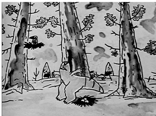
Рис. 3. Кадр, на котором запечатлен над гнездом Белый бобер, которого прогоняют птицы

3. Эпизод, в котором Белый бобер находит на земле гнездо и усаживается высидывать находящиеся в нем яйца, а его прогоняют птицы (рис. 3).