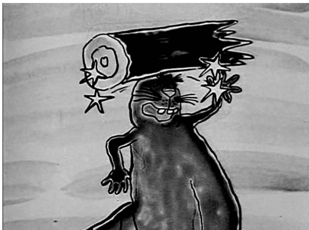
Рис. 1. Кадр, на котором запечатлен момент удара бревном по голове бобра-прораба

2. Эпизод с прыжком, в котором главный герой — Белый бобер в надежде взлететь прыгает с обрыва, что заканчивается его падением (рис. 2).