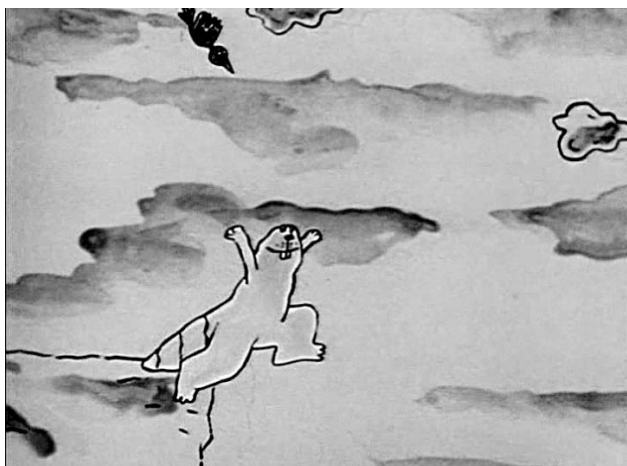
Рис. 2. Кадр, на котором запечатлен момент прыжка Белого бобра с обрыва

2. Эпизод с прыжком, в котором главный герой — Белый бобер в надежде взлететь прыгает с обрыва, что заканчивается его падением (рис. 2).