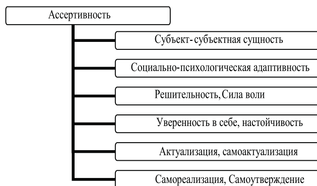
Рис. 1. Структура асертивности

Анализ исследований позволяет выделить структуру асертивных свойств личности.