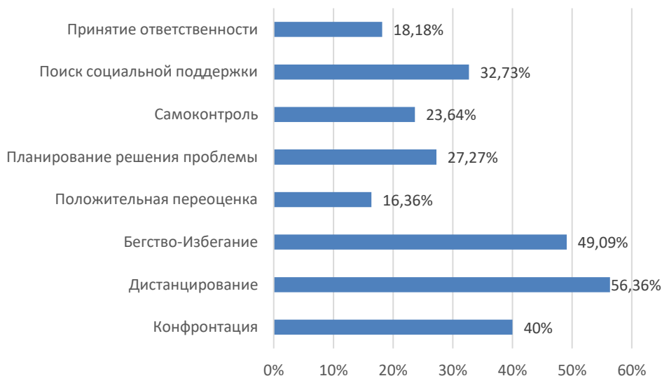
Рис. 2. Представленность стратегий совладания учащихся психолого-педагогических классов (методика WCQ)

коллектива, причем неважно, чем оно вызвано — социально одобряемыми или не одобряемыми действиями. Тем самым с помощью общения и поддержания социальных контактов учащиеся могут отвлечься от своих проблем, значительно отложив их решение или совершенно забыв о них.