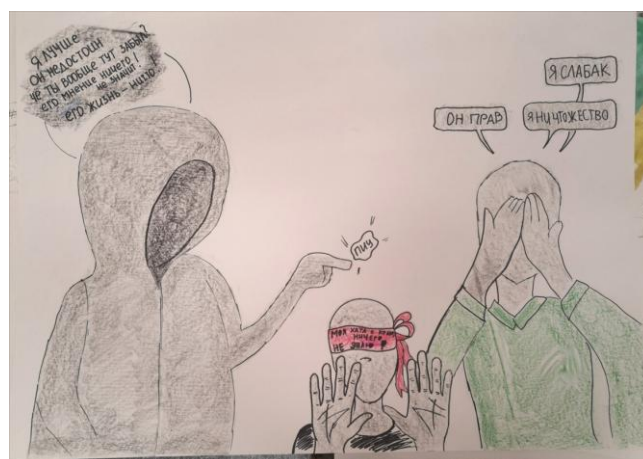
Рис. 1. Результаты обсуждения темы «Участники травли»

А.И. Копытин отмечает, что, независимо от конкретных форм обсуждения изобразительной продукции и других аспектов арт-терапевтического процесса, их основная задача заключается в том, чтобы помочь клиенту в осознании различных содержаний своего внутреннего мира и их связи со своими проблемами и системой отношений [6]. Поэтому интерпретация и вербальная обратная связь являются важнейшим фактором психотерапевтического эффекта в арт-терапии.