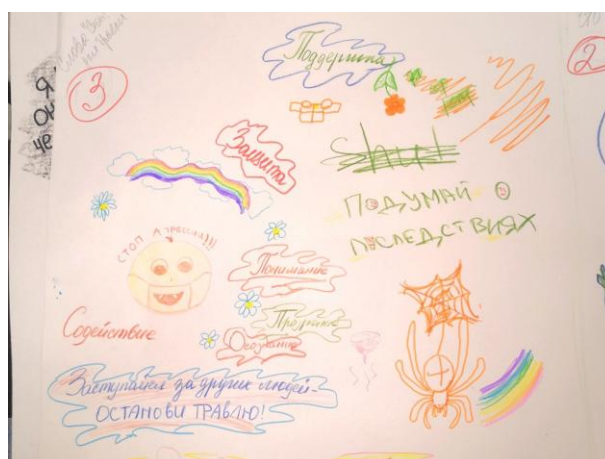
Рис. 8. Результаты обсуждения темы «Слова «Стоп!» в ситуации травли»

Помимо использования рисуночных техник, в тренинге применяются методы сказкотерапии. Приведем отрывок сказки, созданной в одной из групп в ходе работы: «В один учебный день, когда девочки забили Пэсон в угол и избивали ее ногами, Сон смогла выбраться и убежать куда подальше. Хильвин же приказала всем идти в класс, а сама побежала за жертвой. Сон была сообразительной девочкой, так что, убегая от обидчицы, она воспользовалась заклинанием и