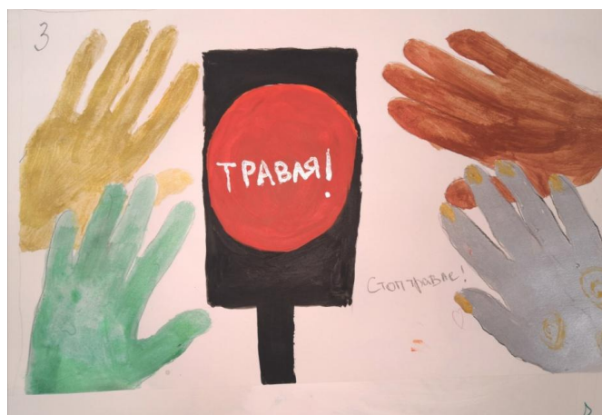
Рис. 7. Результаты обсуждения темы «Слова «Стоп!» в ситуации травли»