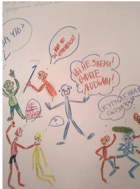
Рис. 3. Результаты обсуждения темы «Участники травли»