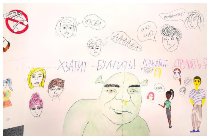
Рис. 2. Результаты обсуждения темы «Участники травли»