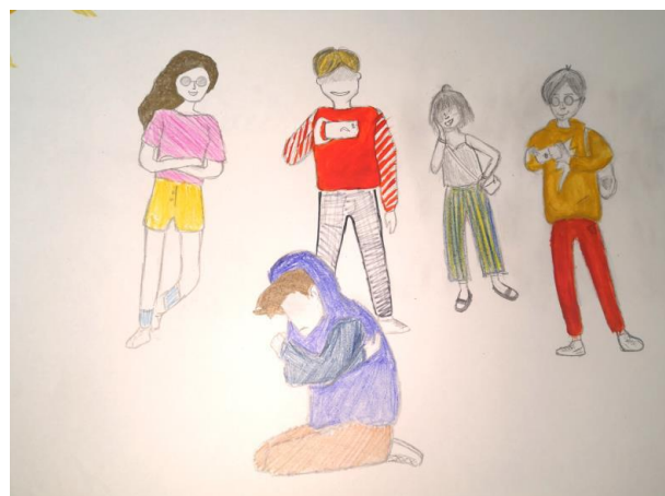
Рис. 5. Результаты обсуждения темы «Что чувствует жертва травли?»