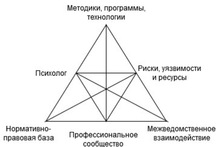
Рисунок 2. Модель профессиональной деятельности психолога системы профилактики девиантного поведения несовершеннолетних

Соответственно, схему профессиональной деятельности психолога системы профилактики девиантного поведения несовершеннолетних можно представить так (рис. 2).