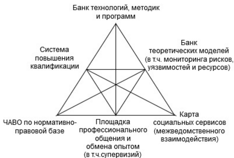
Рисунок 3. Модель обеспечения профессиональной деятельности психолога системы профилактики девиантного поведения несовершеннолетних

Перейдем к следующему вопросу: как подготовить психологов к работе с девиантным поведением. Вернемся снова к модели профессиональной деятельности и сформулируем нужные для профилактической работы компетенции.