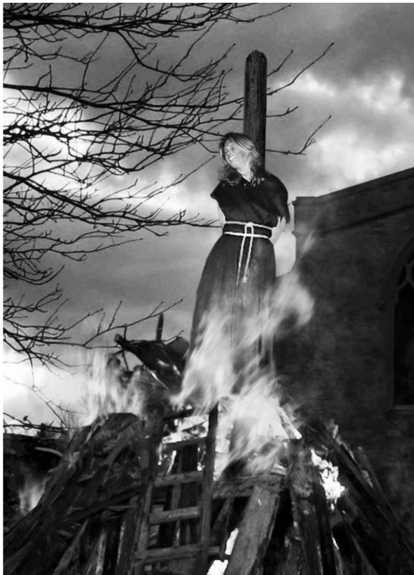
Рис. 4.

Далее ведущий объясняет, что столь крутые методы были вполне оправданны. Чтобы убедиться в этом, достаточно беспристрастно оценить, сколько вреда успел причинить ничем не оправданный крестьянский бунт. Сухие цифры и факты говорят сами за себя.