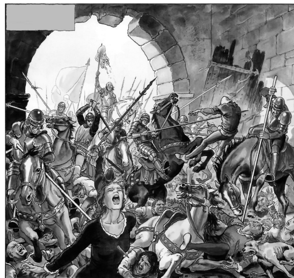
Рис. 3. Фрагмент комикса «Борджиа» итальянского художника-иллюстратора Маурилио Манара

После этого ведущий расскажет, что на сегодняшний день уничтожено в общей сложности 20 тыс. бунтовщиков и сочувствующих им. Часть из этих людей казнили после официального судебного разбирательства и публичных пыток (например, предводителя вос-