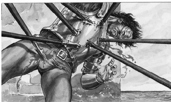
Рис. 6.

Что произошло дальше, рассказали случайные прохожие. Выглядело это примерно так (рис 6).