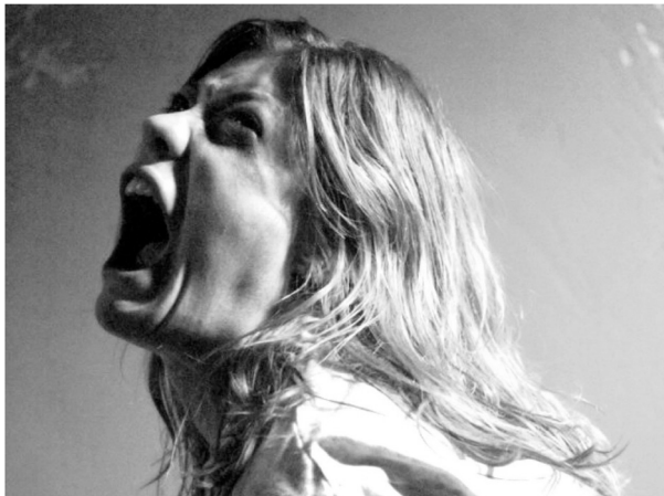
Рис. 1. Кадр из фильма «Шесть демонов Эмили Роуз»

болью, несколько секунд показывают крупным планом во весь экран (рис. 1).