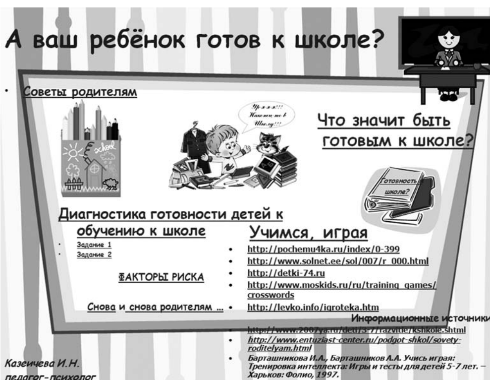
Рис. 4. Плакат «А ваш ребенок готов к школе?»