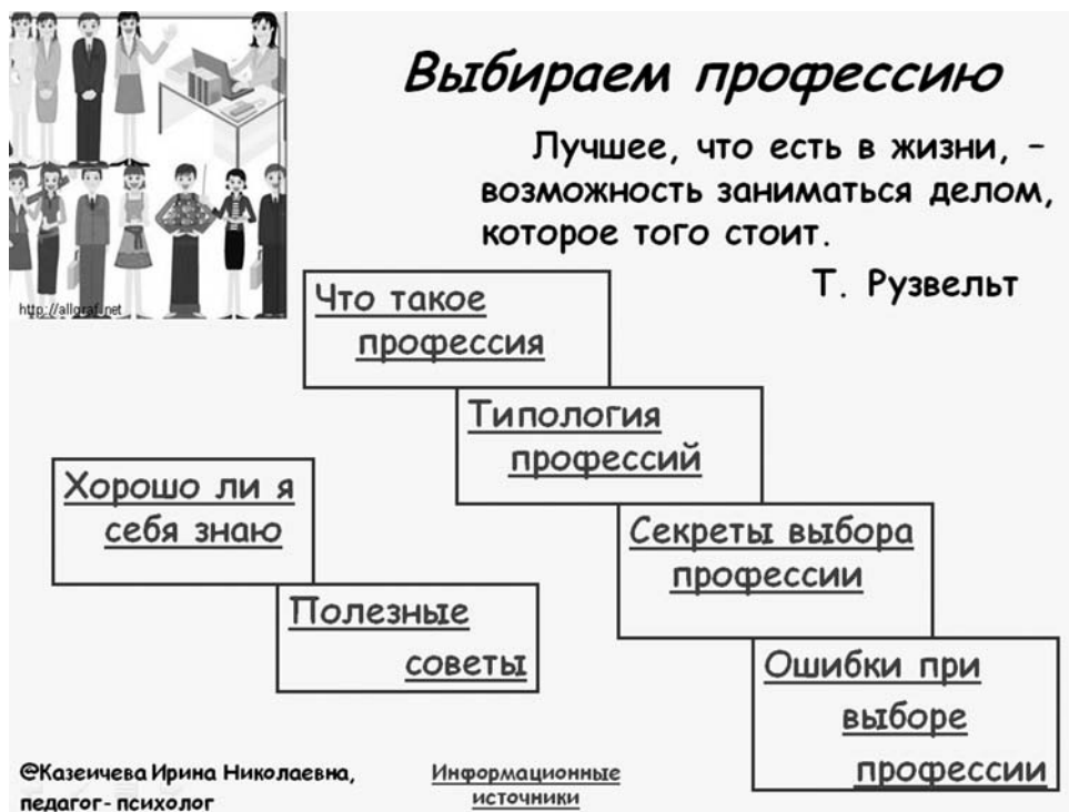
Рис. 6. Плакат «Выбираем профессию»

дители не смогли, постеснялись озвучить на родительском собрании; школьникам — получить информацию, которую было неудобно выяснить на занятии при одноклассниках. Таким образом, можно сделать вывод, что персональный сайт педагога-психолога является серьёзным инструментом в работе, поскольку позволяет эффективно распространять специальные психологические знания, оказывать психолого-педагогическую и информационную поддержку семье, педагогическому коллективу, в немалой степени способствует процессу эффективной коммуникации психолога и родителей, педагогов, учащихся школы.