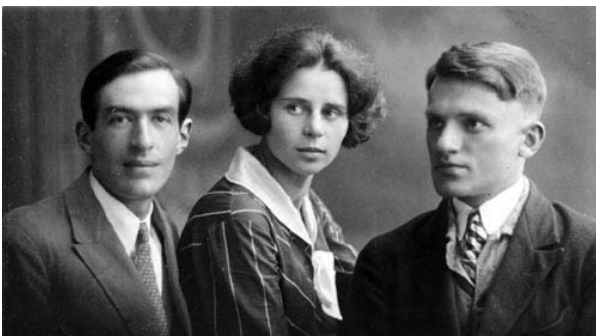
А.Н. Леонтьев, Л.И. Божович, А.В. Запорожец. Начало 30-х годов XX века

Каждый из выступавших глубоко раскрыл ту или иную сторону научного творчества Лидии Ильиничны и поделился своими воспоминаниями и впечатлениями о ее яркой личности, о незабываемом общении с ней. Всеми подчеркивалась мысль о том, как важно не забывать тех, кто до нас разрабатывал научные основы психологии и прокладывал пути их реализации в психологической практике, корректно опираться на то, что ими наработано, найдено, осмыслено, — в этом заключается наша профессиональная культура и возможность движения вперед.