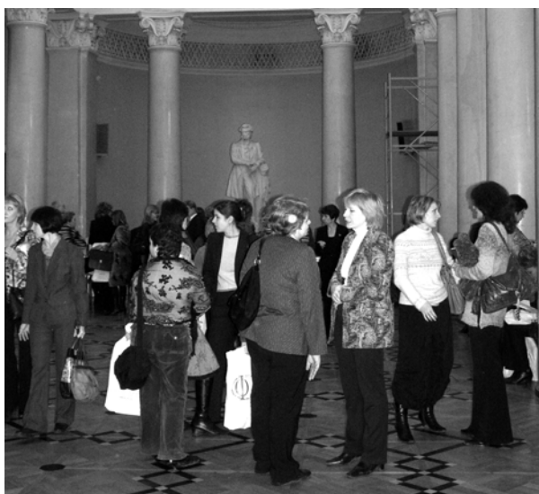
Пленарное заседание проходило в главном здании МГУ им. М.В. Ломоносова

Эта конференция отличалась от двух предыдущих форумов психологов образования России не только своим размахом (и по широте проблематики, и по количеству участников), но и тем, что при ее подготовке и проведении профессиональное психологическое сообщество и представители органов управления образованием выступили «единым фронтом».