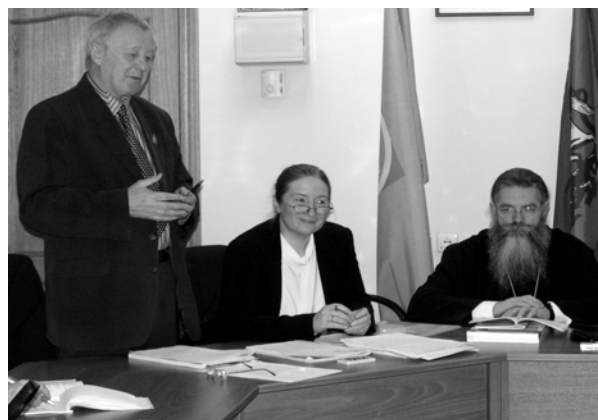
Один из круглых столов был посвящен проблемам духовно-нравственного воспитания современного человека