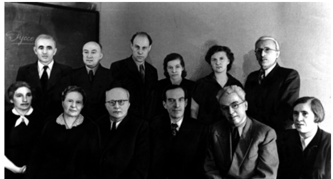
Коллектив кафедры психологии (1953 год)

Научно-исследовательская работа кафедры под руководством С.Л. Рубинштейна проводилась по единому с Институтом научно-исследовательскому плану, была сосредоточена на принципиальных проблемах теории и истории психологии, общей психологии, решении задач прикладного характера по оборонной тематике: проблемы ночного зрения, восстановления функций руки после ранения, восстановления высших психических функций после локальных поражений мозга — этот цикл работ по проблемам функционального развития, нейропсихологии, психофизиологии проводился в период эва-