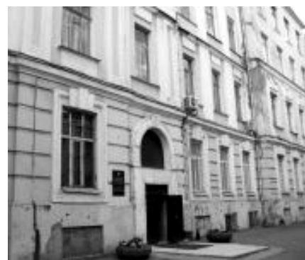
Факультет психологии МГУ