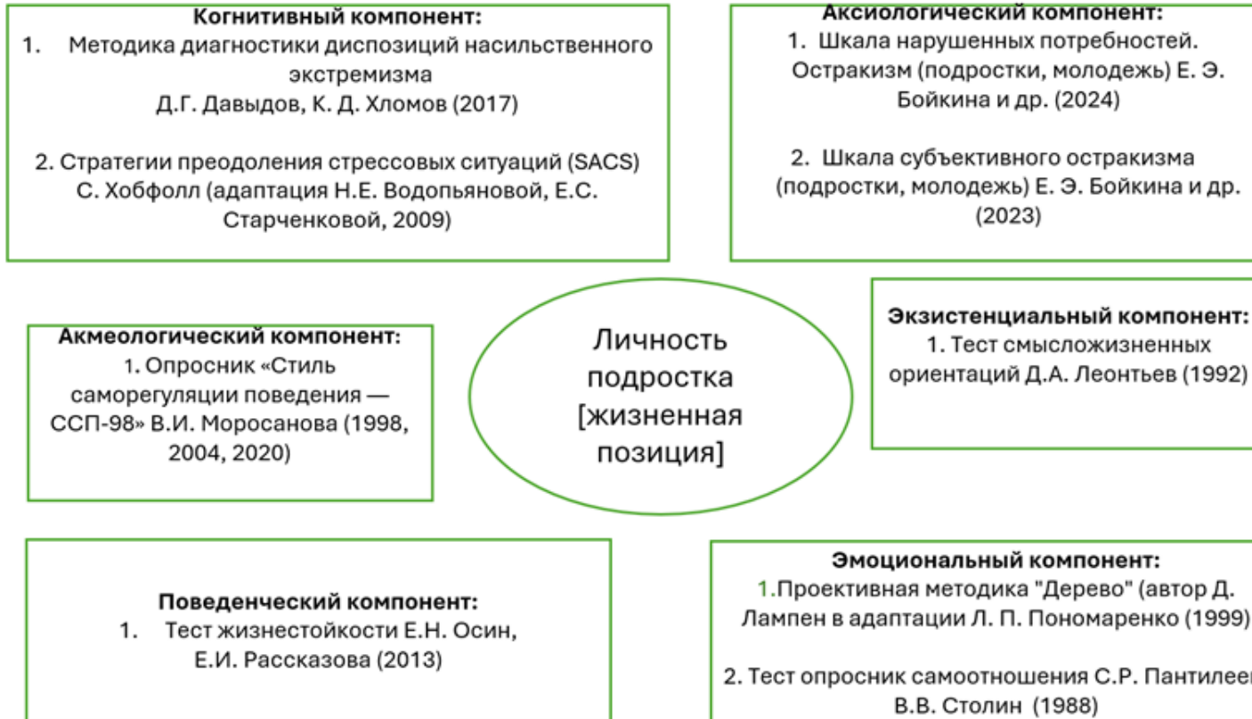
Рисунок. Структура личности подростка [жизненная позиция] с указанием методик для диагностики соответствующих компонентов (на основе модели Бонкало С.В., 2012)